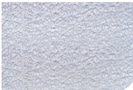
Aspecto superficial UGINOX TG5